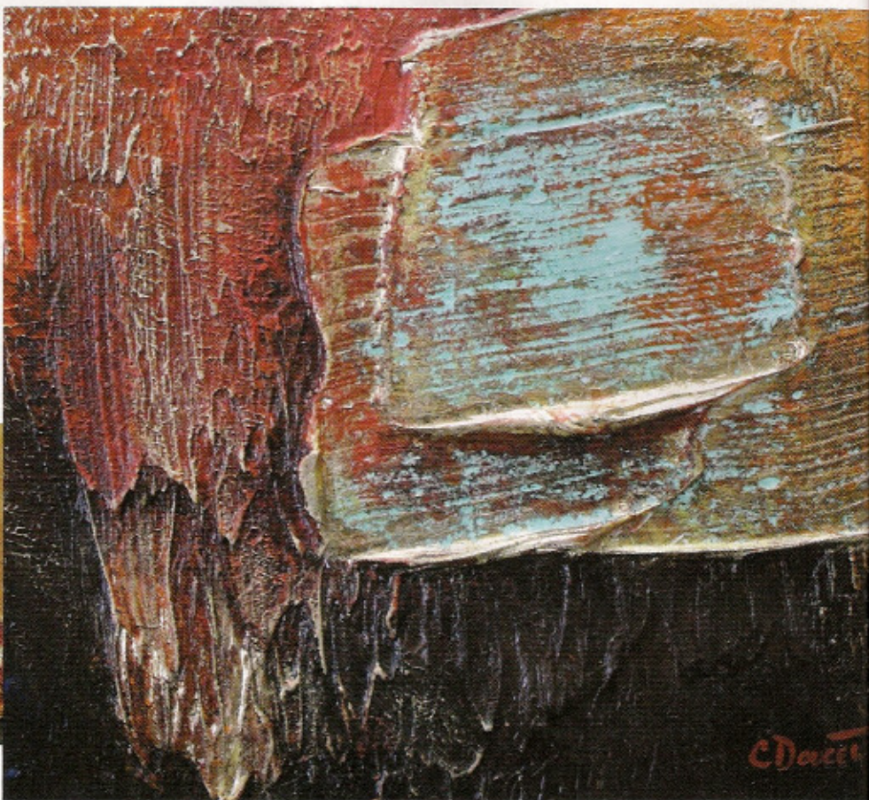
Sous le ciel de Provence I.